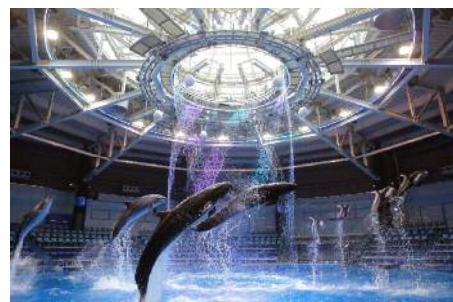
マクセル アクアパーク品川