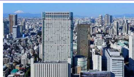
品川プリンスホテル